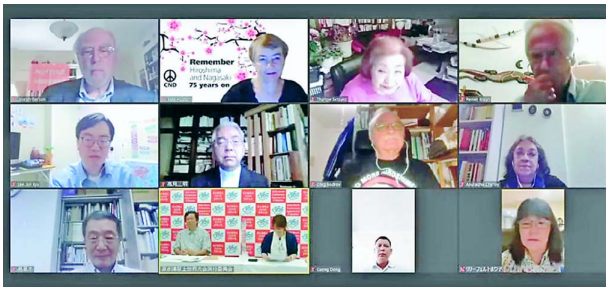
オンラインの画面に映る内外の参加者(2日、国際会議)

広島・長崎への原爆投下から75年。「被爆者とともに、核兵器のない平和で公正な世界を人類と地球の未来のために」をテーマに、8月2~9日、原水爆禁止2020年世界大会が開かれました。初のオンライン開催で、8日には核兵器なくそう女性のつどい(8日)は核兵器なくそう女性のつどい(8日)が号。国際共同行動「平和の波」(6~9日)が日本全国と世界各地でとりくまれました。