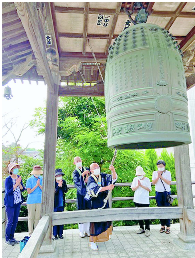
8月6日、趣旨に賛同し平和を願う鐘をつく観音寺に集まって(群馬・藤岡支部)

平和の波 PEACE WAVE FRIEDENSWELLE VAGUE DE PAIX OLA DE PAZ ВОЛНА ЗА МИР 和平的浪潮 موجة السلام