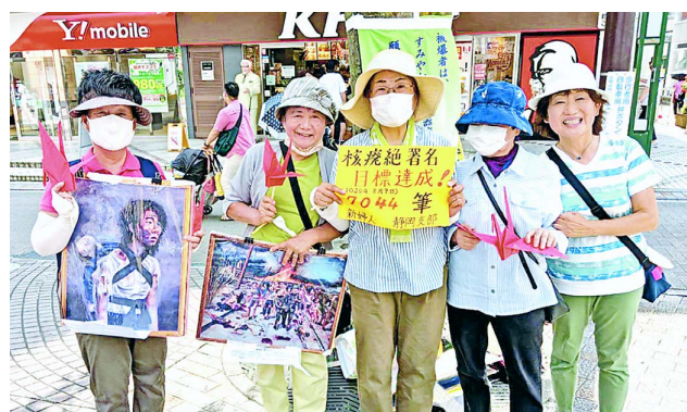
毎週行動し、8月6日に署名目標を超過達成(静岡支部)

つき、世界にはいまだ1万4000発の核兵器が。2000発近い核ミサイルは直ちに発射できる状態で、核兵器は人類生存への脅威です。地球温暖化の深刻な影響を告発する環境活動家の「一瞬にして人も地球も破壊するのが核兵器。核兵器と気候危機の二つの課題での連帯が求められている」と訴え、共感が広がりました。「世界のコロナ禍の最中、核武装国は病院の代わりに核爆弾をつくり、看護師や医師ではなく、ミサイルや爆撃機に巨額のお金を投資している」「軍事ではなく人間のニーズ