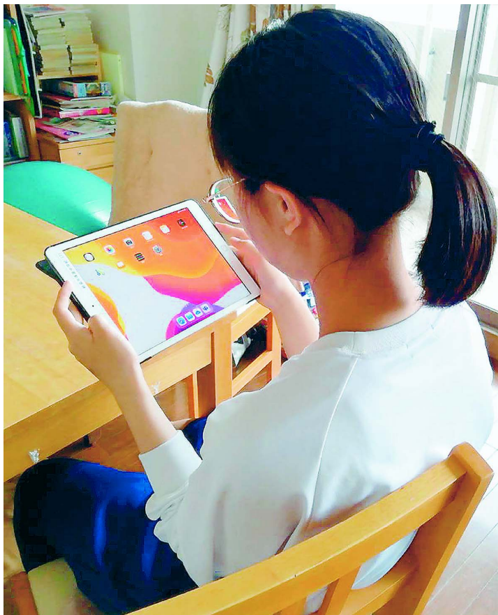
学校貸与のタブレット端末を持ち帰って宿題