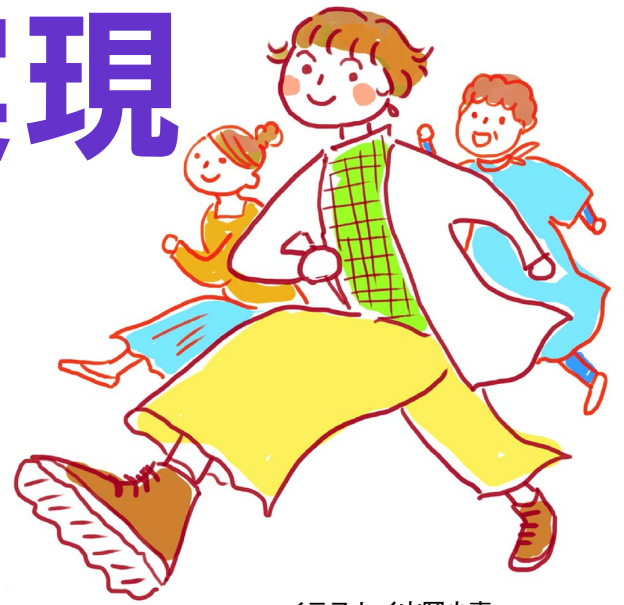
イラスト/山岡小麦

政権交代がキーワードの総選挙が始まりました。私たちが声を上げ、運動してきたさまざまな要求実現のチャンスです。12のテーマをクイズにしました。みなさん、ぜひ挑戦を。