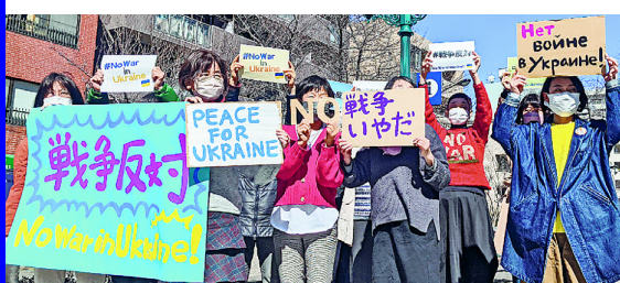
各地で緊急行動 (写真は中央本部・2月25日)