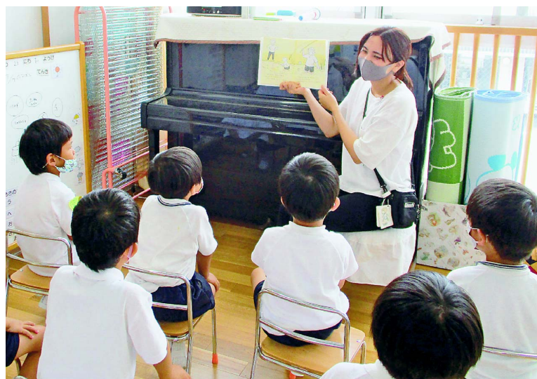
感染対策をしながら絵本の読み聞かせ 公立保育園で