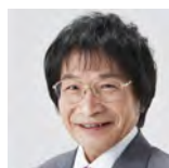
尾木直樹 法政大学名誉教授