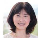
松下佳代 京都大学教授