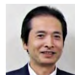
菊地栄治 早稲田大学教授