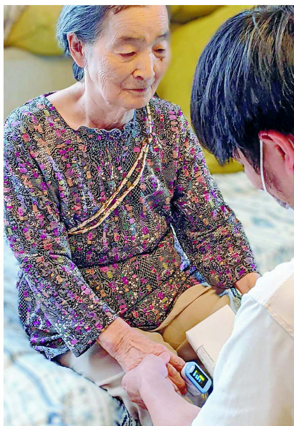
自宅で訪問マッサージを利用している女性。日常的に受ける医療に保険証は欠かせない(本文とは関係ありません)

健康保険証とマイナンバーカードを一体化した「マイナ保険証」で受診される患者さんは、医院の窓口で設置されたカードリーダーに「マイナ保険証」をかざし、顔認証または4ケタの暗証番号を入力します。すると、医療機関が健康保険の資格内容(加入する健康保