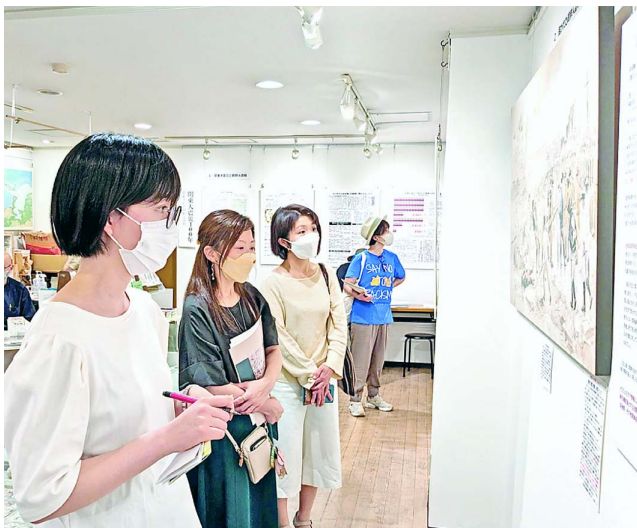
高麗博物館を見学する、新婦人東京都本部次世代チームのみなさん。見学後は別会場で交流会も(関連記事2面)

1923年9月1日午前11時58分に、相模湾を震源に発生したマグニチュード7.9の大地震。住宅の倒壊、火災、土砂災害が相次ぎ、