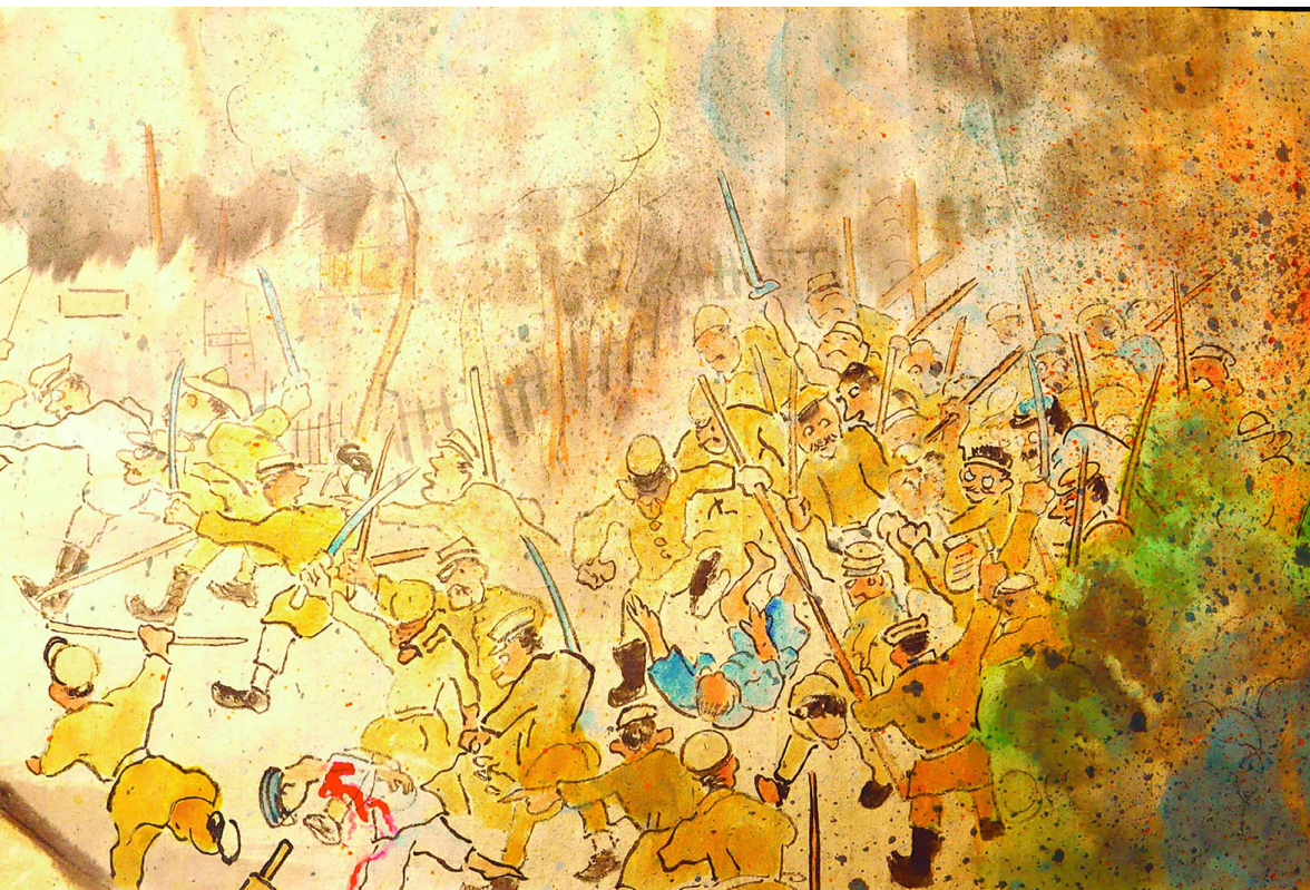
淇谷の「関東大震災絵巻」の一場面(東京・新宿区の高麗博物館で公開中)

犠牲者の名前もわからない、いつどこで、どのように誰によって虐殺されたかもわからない。政