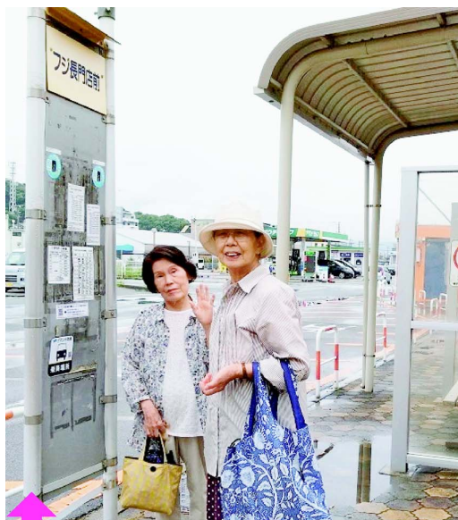
デマンド交通の停留所にもなっているバス停で、長門コスモス班の会員

「市は『大型の』バスに乗ってもらう」というのがそれは違う。市民の自立した生活のために、気軽に乗れて、動きやすい形の公共交通を考えてもらえば、市民はそれを利用する」「もっと市民の