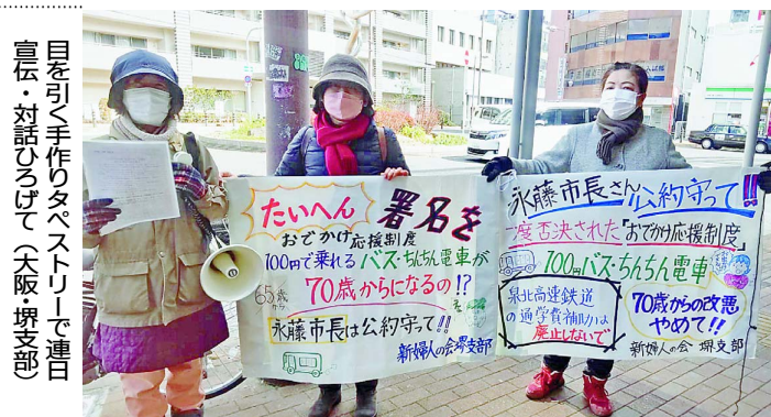
目を引く手作りバスストーリーで連日宣伝・対話ひろげて(大阪堺支部)