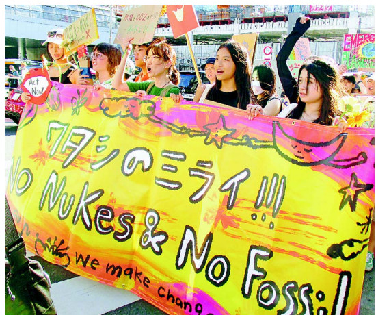
国連気候野心サミットに合わせ、9月18日、原発も気候危機もない再エネ100%社会の実現を求めるイベント&パレード「ワタシのミライ」が東京・代々木公園で開かれ、のべ8000人が参加。新婦人もアピールした