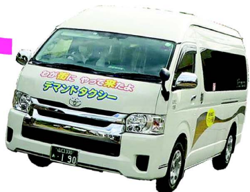
デマンド交通「のろっちゃ」

関を調べることに。2021年のことでした。市に公共交通が何社あるのか、年齢によって特別なサービスがあるのかなど7項目に文書で回答してもらいました。自治体によってサービスが違