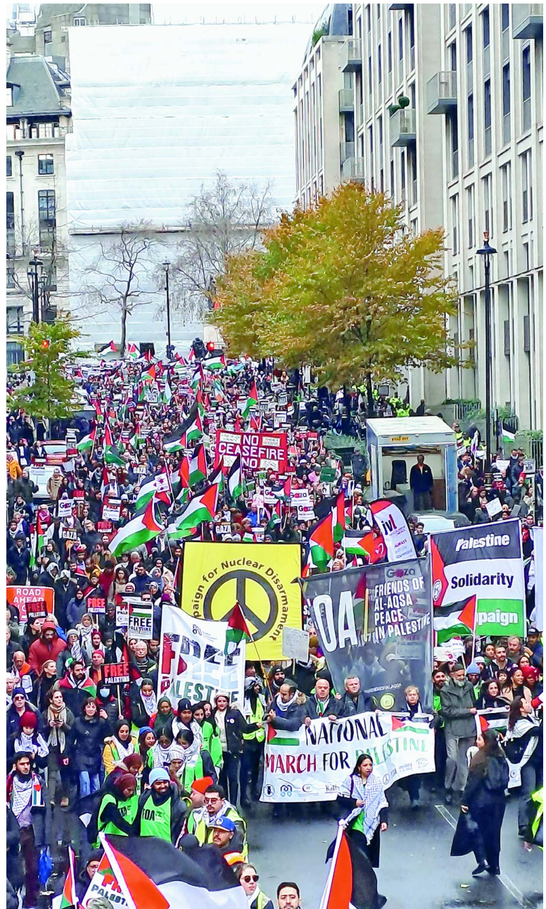
ロンドンで12月9日、「恒久的な停戦を」とガザ連帯デモに数十万人が参加