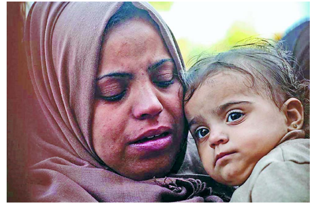
ガザの母と子