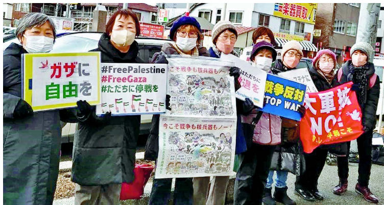
全国各地で新婦人しんぶん12月9日号イラストを手にスタンディング (写真は北海道・豊平支部)