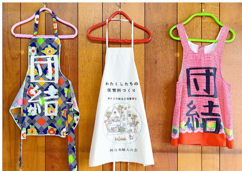
『要求と抵抗』2019

碓井 そうなんです。1960年代、全国で、保育所がどんどんつくられるなど保育運動が盛り上がっていたことをその時代に初めて知り、あの時代