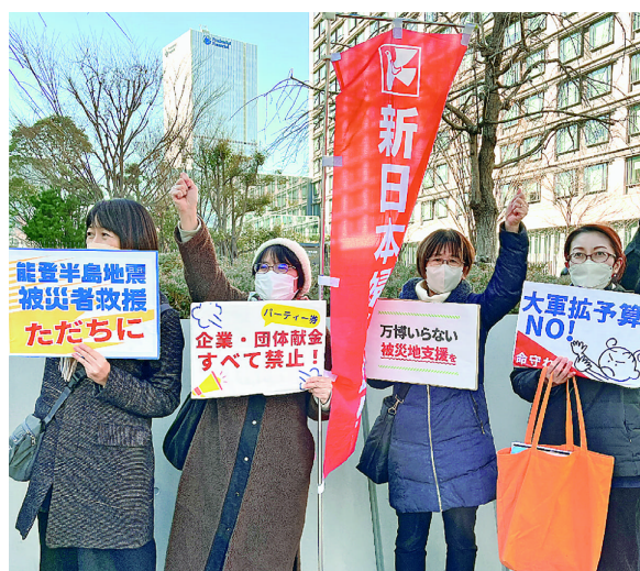
「万博、辺野古新基地建設やめ、被災地支援を」と、国会開会日行動に250人が参加(1月26日)