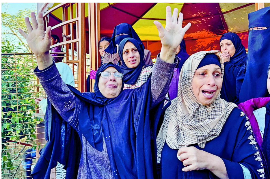
イスラエルの攻撃で殺された家族の葬儀で嘆き悲しむ女性たち。2024年12月16日、ガザ地区南部ハンユニスのナセル病院で