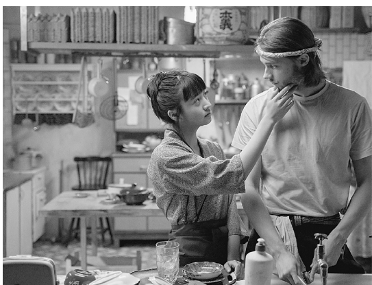
『TOUCH / タッチ』 ©2024 RVK Studios

アルフォンソ・キュアロン監督のトークを通訳する筆者。2024年11月、東京国際映画祭で