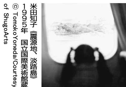
米田知子『源流、淡路島』 1995年 国立国際美術館蔵

◇会期：～3月9日(日) / 開館時間：午前10時～午後6時 入場は閉館30分前 / 休館日：月曜日(ただし1月13日、2月24日開館、1月14日と2月25日は休館)、12月29日～1月3日 / 入館料：一般当日1600円他 / 会場：兵庫県立美術館(阪神岩屋駅徒歩8分、JR神戸線灘駅南口徒歩10分) / 問合せ：TEL078-262-1011