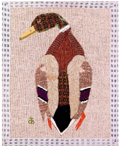
《鴨(背)》(1953年) 豊田市美術館蔵 いろんな種類の布を巧みに組み合わせている