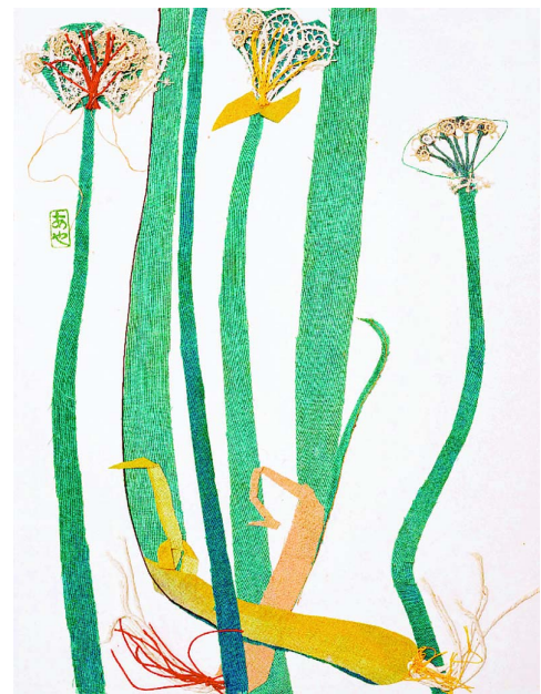
《ねぎ》(1964年) 個人蔵 ネギのたくましい生命力が感じられる