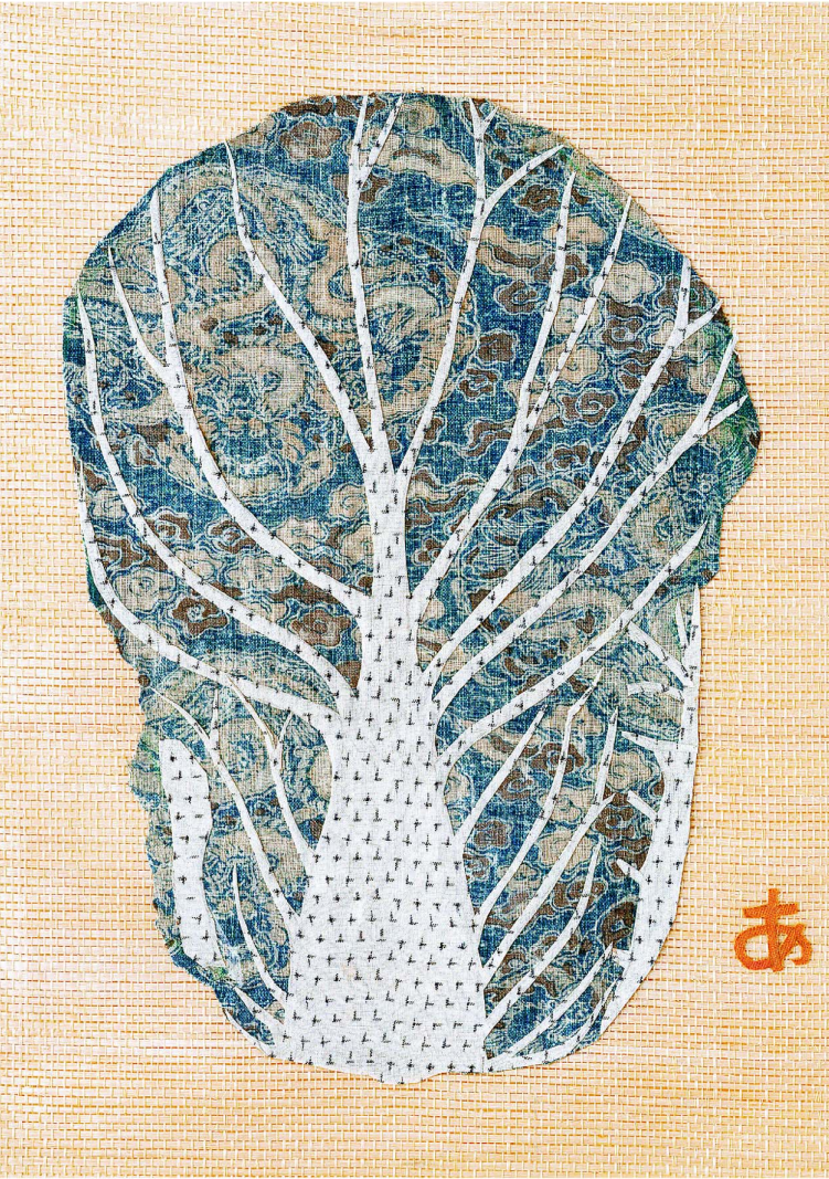
《白菜》(1975年) 豊田市美術館蔵 葉の部分に使っているのは、龍が描かれた布

宮脇の作品は優れた造形性を有している、それが初見のときの率直な感想でした。いちばん驚いたのは、果物や野菜を半分に切った断面を作品