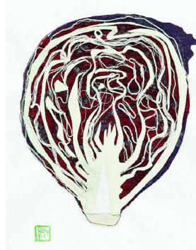
《紫キャベツ》「はりえ日記」第13巻より(1974年) 豊田市美術館蔵 葉が複雑に重なりあう様子を見事に描写