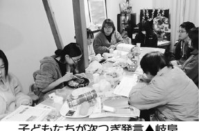
子どもたちが次つぎ発言▲岐阜