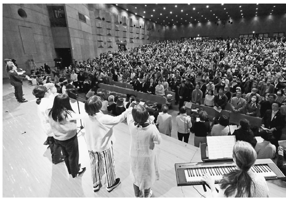
米兵による少女暴行事件に対する抗議と再発防止を求める沖縄県民大会(12月22日)で採択された決議は次のとおりです。

「私たちの誓い、一語、人間の命と尊厳、平和と自由を守るために、さらに深く、もっと長く、共に手をとり合い、闘うことを決意した」(さあ)と、明日に向かって再び力強く歩んでいく