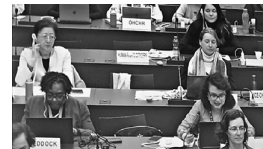
審議では、委員から日本政府に次つぎきびしい質問が