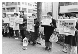
県庁前でスタンディング▲香川