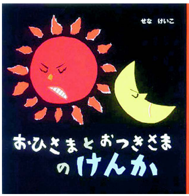
『おひさまとおつきさまのけんか』せなけいこ：作・絵／ポプラ社／2003年／1210円

ある日、「お月さま」が遅刻してきて、「お日さま」は怒鳴りまです。「遅いぞー」。こんなささいなことから、太陽vs月と星の全面戦争がはじまったというお話は、『おひさまとおつきさまのけんか』。『ねないこだれだ』等でおなじみのせなけいこが描いたこの絵本は、戦いの行きつ戻りつ、全てがなくなり闇の世界…と、戦争に直面する姿を描