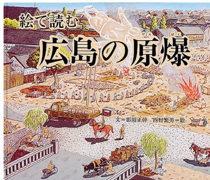
『絵で読む 広島原爆』那須正幹：文、西村繁男：絵／福音館書店／1995年／2860円

『絵で読む広島』は、被爆者が語る地獄絵を描き出すとともに、原子爆弾の構造や威力、人体への影響等を解説しています。核兵器の被害は、広島、長崎だけではなく、ベン・シャーンが