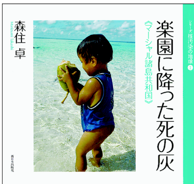
『楽園に降った死の灰』《マーシャル諸島共和国》森住卓：文・写真／新日本出版社／2009年／1650円