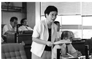
議員1日目、議会で質問(2003年)

任期最後の年、静岡で福祉の仕事をしてきた二女が、親の老後を心配し三股町に戻ってきてくれました。娘は新婦人に入会、もっと福祉をよくしたいと2022年に町議会議員(無所属)に立候補し当選、旺盛に活動しています。私はその年に議員活動を引退。84歳になった今も民生委員を務め、新婦人つづじ班や近所の高齢者のためのサロンを開き、おしゃべりや見守り活動、要求実現など活動をしています。