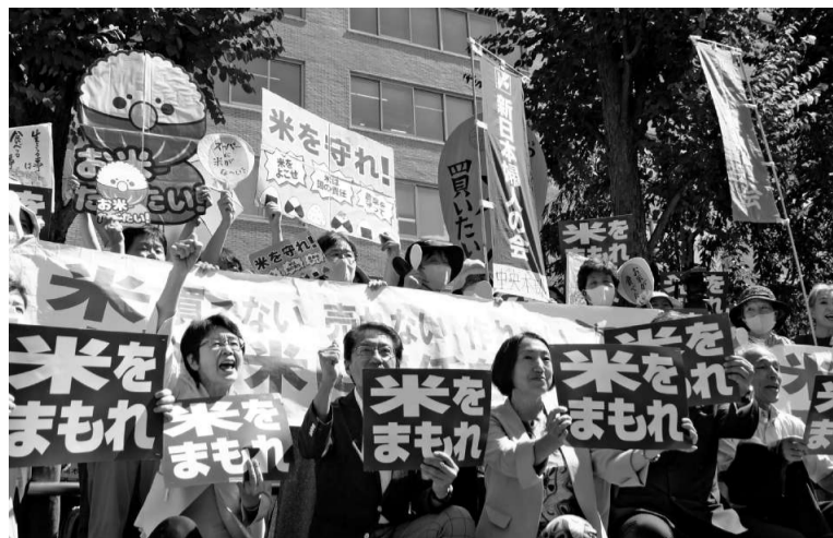
農水省前で米を守れと声をあげる農民連と新婦人、国会議員 (2024年9月)