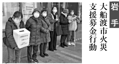
「震災でお世話に」と募金▲岩手