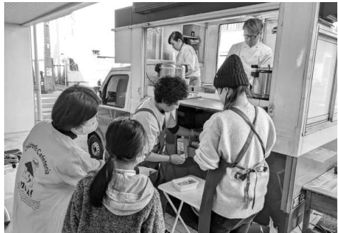
玄関広場には、キッチンカーが出店

地域ぐるみで応援 (協力) 大森東地区自治会連合会/ファミニュー大森南(介護付有料老人ホーム)/地域包括支援センター大森東/大田区社会福祉協議会/大田区立大森南図書館/大田第4小学校PTA