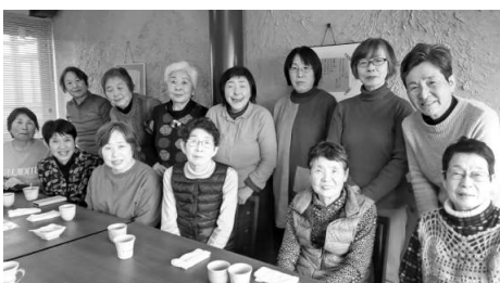
新しく迎えた仲間と▲長野

2日の総会前に配達集金交流会を開き、毎週9部のしんぶん配達、集金の流れを確認。携わっているのは18人。支部ニュースを事務所に取りに行く人も増えて1人の負担も軽くなりました。総会後はオカリナ演奏でコーラス小組が歌い、楽しく交流しました。