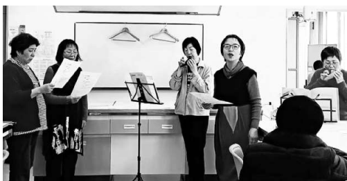
交流会でオカリナに合わせて▲北海道

2日の総会前に配達集金交流会を開き、毎週9部のしんぶん配達、集金の流れを確認。携わっているのは18人。支部ニュースを事務所に取りに行く人も増えて1人の負担も軽くなりました。総会後はオカリナ演奏でコーラス小組が歌い、楽しく交流しました。