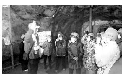
後世に伝えたい▲群馬

【益城支部 甲斐幸美】4月14日、16日の前震・本震と震度7が2回も襲った熊本地震から9年目を迎えた益城町。被災した役場庁舎が再建された後、機に役場前の「非核平和都市宣言」の看板の再建を、県原水協と新婦人益城支部で町に要望する。署名も104に。