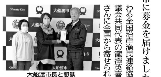
大船渡市長と懇談