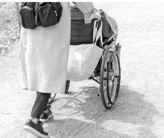
久しぶりの外出(本文とは関係ありません)