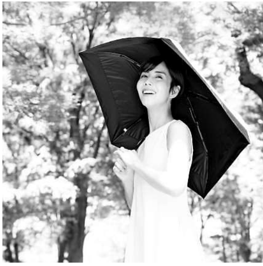
日傘で日光をさえぎって