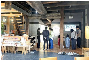
石の床から靴を脱いで上がる

今回展示されているのは、絵画、映像作品、インスタレーションなど、手法もさまざまな6人の作品。大きな窓から外光がふんだんに入る部屋には、ぐるぐると丸を描いた作品が並びます。強いコントラストで描かれた丸は躍動しているよう