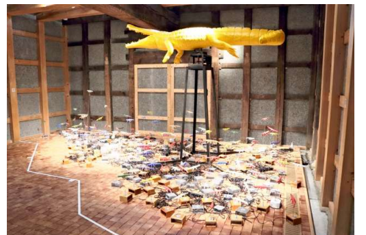
タムラサトル「スピンドロコダイル・ガーデン」

あちこちに置かれたテレビに、街の風景の中で人が回っている光景が映し出されています。さらに奥の部屋には、たくさん