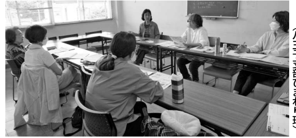
都政班会で「声を上げ運動する ことが実現のカギ」と対話に (八王子支部ひまわり班)

米軍横田基地は、5市 1町にまたがる広大な土 地を専有、航空自衛隊航 空総隊司令部も同じ敷地 内に。アメリカの対中国