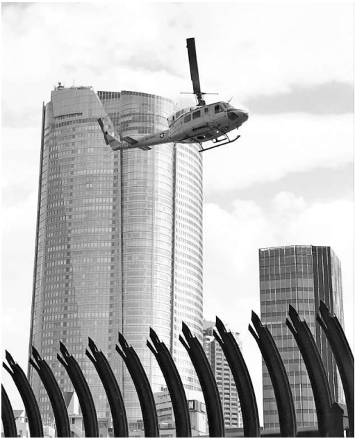
毎日のように飛来する米軍横田基地の軍用ヘリ。後ろのビルは六本木ヒルズ

「1面より」 タワーマンションあり きの再開発を都内各地で すすめ、都市計画公園と して規制していた神宮外 苑までも再開発の対象と するなど、街と自然を壊 し続けています。一方、 都営住宅の新規建築は、 26年間ゼロ。「マンシヨ ンが高すぎる」「ほしい のはたかさんの都営住 宅」「いつまでも暮らせ る東京に「など切実です。 多摩地域では、巨大デ ータセンター(※1)の 建設が次つぎ計画され、 大量の電気を使い、住環 境の破壊も問題になって います。日野支部の集め た「いちようカード」に も「データセンターの稼 働による騒音と振動は困 ります」「住宅のすぐそ ばに超高層の建物はNO !」などの声が。