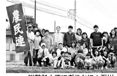
総勢31人でぎやかに▲石川

田植え体験です。能登地震により、お米を作れない農家も多く、お米高騰の中、自分が植えた苗が大きくなり、自然の恵みの中でお米になり、毎日のご飯がおいしく食べれることを親子で学びました。