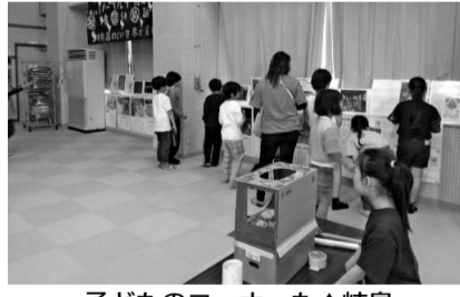
子どものコーナーも▲楡葉

沖縄は梅雨に入り、月桃がたわな美を付け始めている。日本軍の組織的戦術が終わったとされる6月23日は「慰霊の日」。慰霊月間を迎えている。