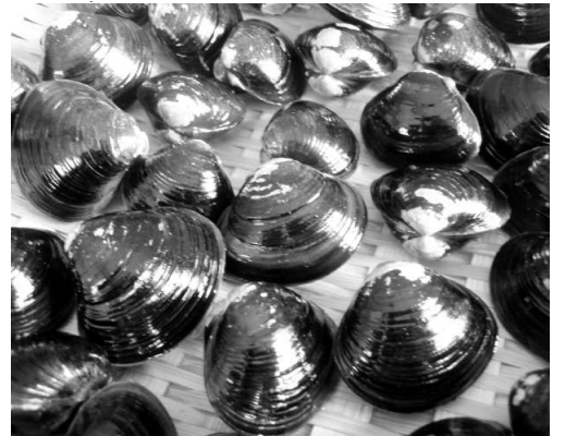
栄養価が高いシジミ