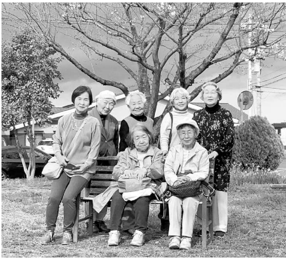
班会でお出かけ (あざみ班)

あざみ班には、家族 遠くに出かけられないの介護や高齢のために 会員もいて、近所で開