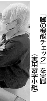
「脚の機能チェック」を実践 (実用習字小組)

めに使うなんて!」と話に。また、お米の問題についても、「近所のお店に行く、アメリカ産のお米をよく見かけるようになった」「米不足の原因は減反政策や市場まかせにしてきた政府の失策」などおしゃべりが盛り上がり、Sさんが「政治の話ができたのは新婦人が初めて。みなさん