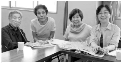
貴重な体験を聞いた▲福岡

今年3月に100歳になった会員が「10年前、乱暴ハズルの解き方とちぎり絵をすることに。平和のとろくみへ力をもちた楽しい班会でした。」