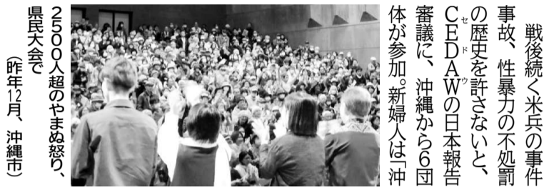
2500人超のやまぬ怒り、県民大会

戦後続く米兵の事件、歴史を許さないと、CEDAWの日本報告審議に、沖縄から6団体が参加。新婦人は沖縄に「CEDAW」と言いつつ、米兵の性暴力を隠し、被害者の権利を守らねばならない、私たちが訴えが質問に反映されたのです。 CEDAWがまだ総括所見(昨年10月)では、在沖米軍人による性暴力について懸念が示され、暴力を防止し、県内外に賛同