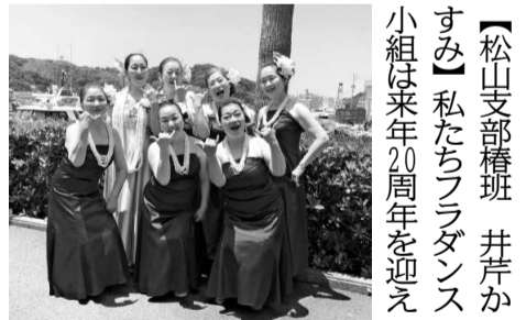
ココはハワイ?!▲愛媛

平和を守る活動をしている新婦人を知り入会、新婦人の集まりに一度参加してみたいと思つたと元気に参加されました。「終戦の時は20歳、教師をしていたが戦争で亡くなった教え子の顔が目につく感じがして、しばらく離れた教壇に立つた時「教え子を再び戦場に送らない」と掲げた組合にすぐに入った。弾圧もあつたが組合はやめなかつた。悲惨な戦争は絶対にしてはいけない。これからは伝えていきたい」と貴重な体験を話しました。体を動かしてみんなとおしゃべりすることが元氣のもと、と。来月の班会の日程も決まり、乱暴ハズルの解き方とちぎり絵をすることに。平和のとろくみへ力をもちた楽しい班会でした。