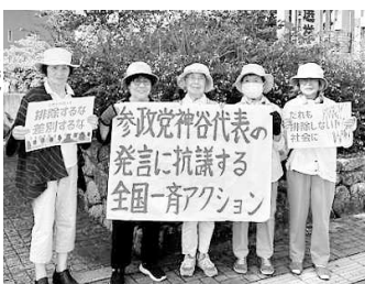
14人でスタンディング▲愛媛

東温支部は「こんな発言は許せない！」と支部委員会話し合い、翌12日、市役所前の通りで横断幕とプラスターを掲げてのスタンディングに5人が参加。車の中から見てくれる人もいました。