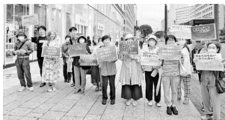
若い女性も「やってくれてよかった」と▲宮城

参政党を取材にきていた新聞記者が、「載せません」と私たちのチラシを持っていきました。