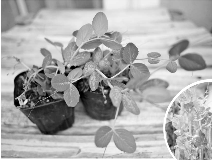
土に植えた豆苗は育つとエンドウマメに