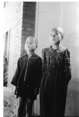
「髪の毛の抜けた姉弟」

見終わって「原爆のこと、被爆について、まだ知らないことの方が多いいのではないか」という思いにかられました。一瞬のうち命を奪われ、遺骨が見つからない人がいること。人類史上初の原爆が人間にもたらしたものに続いて、私たちの今日があります。