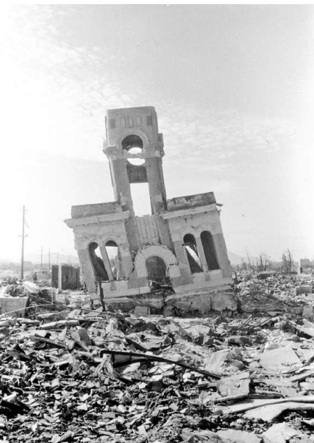
「下村時計店」

原爆ドームとどこまでも続く焼け跡のパノラマ写真は、何枚ものコマをつなぎ横2次元近い大きさ。国の学術調査に同行し、10月、広島に入った写真家の林重男さんが撮った爆心地一帯です。説明文に、