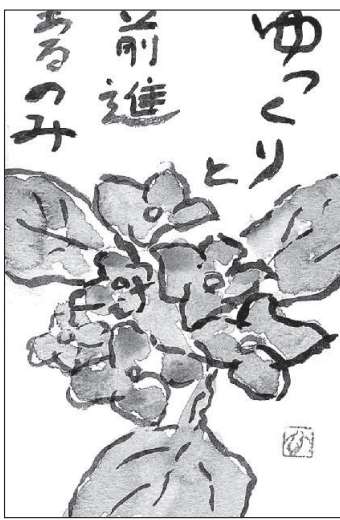
長野・上田市 中村紘子 (82)