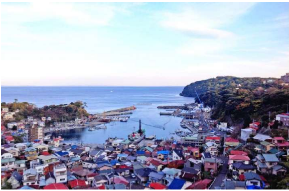
高い建物がなく、素朴な景色が広がる真鶴町 (真鶴町観光協会提供)