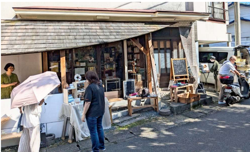
「道草書店」の軒下に小さなにぎわいが。第2回「みちくさ市 小さな軒下マルシェ」(6月21日)より

「真鶴は、たまたまドライブで通りかかると話してきたんです。自然の中でもう少しゆつくり子育てがしたい」と話したのは道子さん。