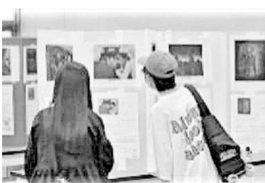
折り鶴、絵本、署名コーナーも▲福岡

折り鶴や絵本、署名コーナーも用意し、約100人が見に来ました。署名も34、折り鶴もたくさん折りました。「家に帰って折ります」という人もいました。