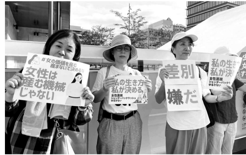
女性への視察発言に抗議のスタンディング

の思いを実現できる体験として新しい会員を迎えています。 「築き上げた組織を確信に、小組で運動仲間づくり」 会員の高齢化がすすむなかでも、全国どこでも行動を起こせるのは、先輩たちがすすみに班支部をつくって組織を築き、今にも維持する努力があるからです。 今回の全国大会を前大会時の会員数を超えて迎えようと、「要求いっばい」会員大募集!「毎月前進」にこだわってきました。「読者を会員に」人気の健康マージャンをはじめ多彩な要求別小組、体験も「五つ」の目的や新婦人しんぶんの並走の経験に学ぶとりの紹介、原爆パネルやミニ学習で新婦人を知ることができ、また行動や運動でも入会を歓迎しました。「あの人、この