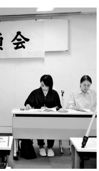
194回中央委員会で報告する由比ヶ浜事務所局長

拡充を求める秋の行動」署名は24年43万9358人分、25年41万447人分を国会に届けました。各地で自治体へ要請し、猛暑が続く中で小中学校の教室や体育館へのエアコン設置がすすみ、「ミニミニバス」の運行「バス停に椅子の設置」などが実現。また、高校受験の機会確保に「月経不調」(月経中、月経前の体調不良)が含まれる成果もありました。 女性への視察発言への緊急抗議アクションでは、職場班や親子リズム小組からも行動、飛び入り参加やSNSを見て駆けつけ、「よびかけてくれてありがとう」と入会、地元メディアも取り上げ、ジェンダーバックラッシュを許さない機動的な行動となりました。 「コンビニエンスストアの「成人誌復活」で緊急調査(3241店舗)をおこない、大手3社の本社や地域ストアの本社に要請、撤去や縮小が実現しました。「インターネッ