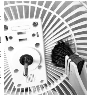
はけで汚れを落とす