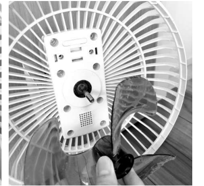
羽根を取りはずして