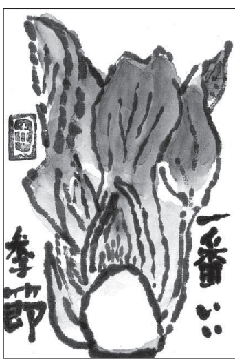
京都市 川口立子 (83)