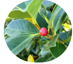
倒れた木の枝から実も

伊江島で最後に訪れたのは、沖縄に伝わる言葉「命どま」の家。その言葉の意味を改めて感じながら、島をあとにしました。