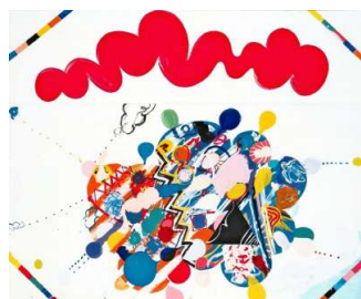
山崎つる子「命どま」1963年 兵庫県立美術館蔵(山村コレクション) ©Estate of Tsuruiko Yamazaki courtesy of LADS Gallery, Osaka and Take Ninagawa, Tokyo

が、伝統的なジェンダー秩序の揺り戻しが生じると批評対象から外され、歴史から姿を消す。こうした経緯に対抗したのが「アンチ・アクション」という言葉だ。本展では、草間彌生、田中敦子など14人の女性作家の作品120点を展示。ジェンダー研究の視点から美術史の読み直しを図る。