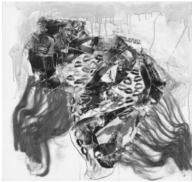
田部光子《プラカード》1961年、東京都現代美術館蔵

■~2026年2月15日(日)10:00~17:00、金曜日は20:00まで(入場は閉館の30分前まで) / 休館日 月曜日 (ただし1月12日は開館)、1月13日、年末年始 (12月28日~1月15日) は休館 / 国立国際美術館 (大阪市北区中之島4-2-55) 地下3階 展示室 / 一般1500円他 / 問合せ06-6447-4680