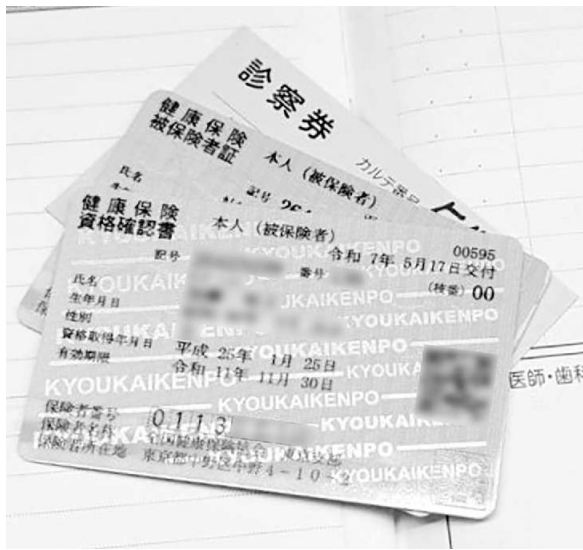
念のため保険証も確認書も持って受診