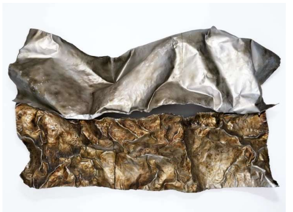
多田美波 《周波数 37303055MC》 1963年 多田美波研究所蔵

この時代に、「アンフォルメル」、次いで「アクション・ペインティング」と呼ばれた抽象芸術の様式が海外から日本に入り、一世を風靡しました。当初は、多くの女性美術家も注目されましたが、力強さや豪快さといった「アクション」の評価が中心になる