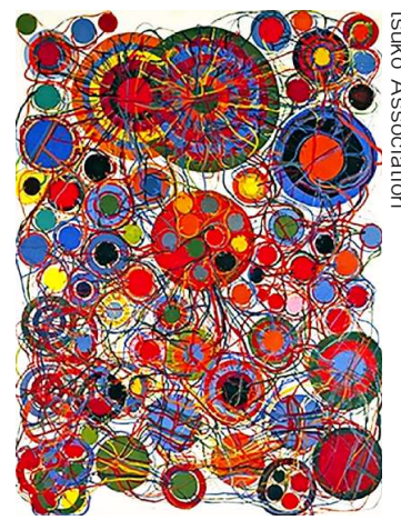
田中敦子 《地獄門》 1965-69年 国立国際美術館蔵