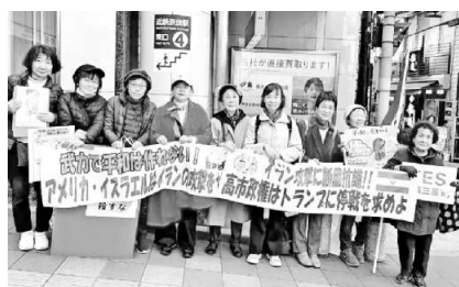
横断幕も作った▲奈良

【奈良支部・生駒支部】3月2日、緊急宣言をしました。国際法を無視し、イランに武力攻撃をした