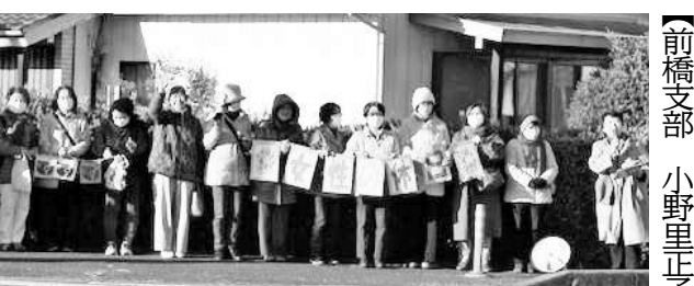
赤色を身に着けて▲群馬