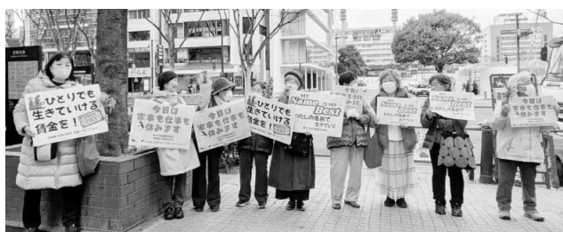
要求かかげて▲宮城