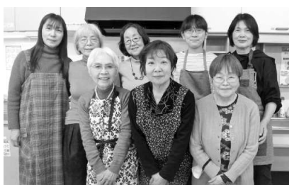
おいしくできた▲福岡

【若松支部山ゆり班 南 視聴、班の10年のあゆみ の話、選挙真つたた中で しんぶん号外を紹介、そ して、一人一言発言。各 小組でしんぶんタイムも 引き続きとり、学びなが ら楽しく大きく。昨年、 広島の高校生の描いた原