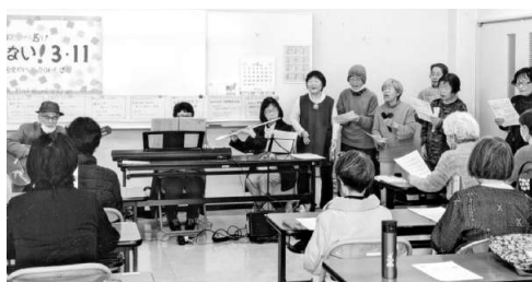
歌声や支援バザーも▲広島

今回は、15年前、原発事故の被害で、広島市から、生まれ育った広島市に自主避難してきた人に、15年間の思いを語ってもらいました。テーマは「忘れない原発事故。原発がもたらした暮らしの中の暴力」です。彼女は、「自給自足」