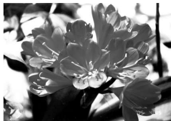
中内さんの自宅、庭に咲いたアマリリス

くれ、私は余計に傷つきました。私はこの後、信者だった母と父が出会い駆け落ちし、逃げた大聖教の教会に預けられました。中学は、徳島県半田町の中学校へ進学。母は、この町の裕福な家に生まれましたが、祖母を早くに亡くし、祖父が養子から帰らなくなるまで、父親に反感を持った伯父の散財で、裕福とはほど遠い状況になっていました。私は、伯父、叔母の家とたらい回しになり3つの中学に通い、いつしかしゃべらない、笑わない子になっていました。つづく