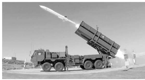
国産の1式地对空誘導弾能力向上型(地発型)の発射試験(防衛省ホームページ)

2022年度まではGDP(国内総生産)約1% (5・4兆円) だった日本の軍事費が、高市自民・維新政権によって25年度で2%の1兆円に。戦争で世界中を混乱させているロシア米政権は、さらにも3・5% (24・2兆円)、5% (34・6兆円) を要求しています。憲法9条や25条をもつ国で、大軍拡の財源を生み出すために暮らしや社会保障の切り捨て、軍拡(防衛)増税新設など、せつないに許されません。