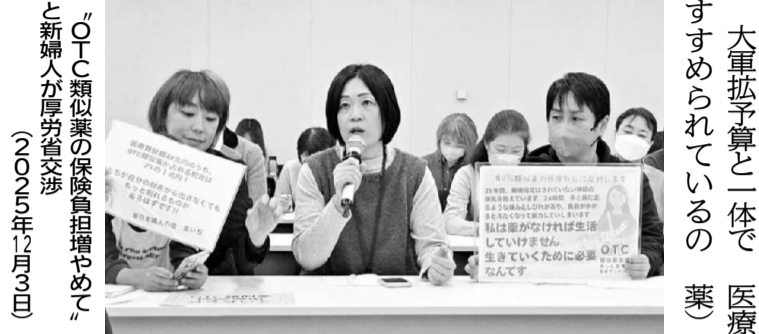
OTC類似業の保険料増やめてと新人が厚労省交渉(2026年12月3日)

大軍拡予算と一体ですすめられているの薬、医療費の削減、医療保険で処方される療や治療などの保険給付外とした、患者負担増の制度改悪がねらわれています。