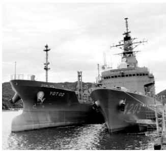
須崎港で訓練する自衛隊

される施設は他国から武力攻撃が禁止されません。標的となるリスクについて知事は、港湾の整備費や災害時の迅速な対応につながるなど「メリットがリスクを上回る」と発言しました。標的となれば、犠牲は住民に強いられます。