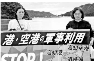
軍港化STOP!訓練に抗議

が行われました。統合演習の一環で、須崎港で海上からの訓練支援艦に高速無人標的機と燃料を搭載するものでした。県内の民間施設で戦後初めて行われる軍事訓練に、当日は市内外から約50名が集まり抗議の集会を行いました。