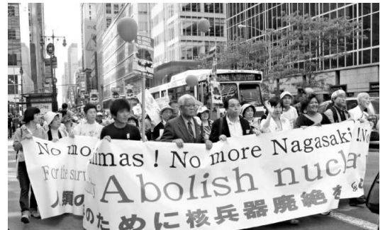
2010年の国際共同行動inニューヨーク