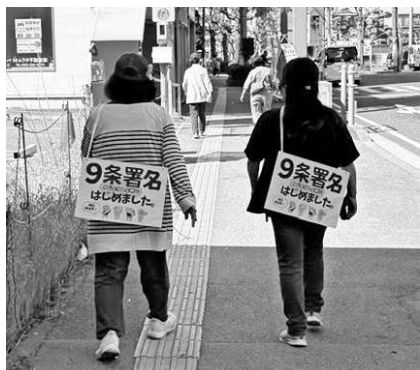
県本部と新潟支部で署名行動。その後、背中でもアピールしてウォーク

X(旧ツイッター)の記事、「平和じゃないと積読できない」をきっかけにみんなで本を持ち寄る「積読デモ」を企画しました。新婦人の真ん中世代やSNSで呼びかけた6人と子ども1人が参加。本の埃を払い、テンションの上がるブックカバーをつけて、いざ日の当たる世