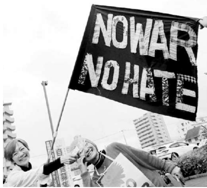
平和憲法を守るデモで