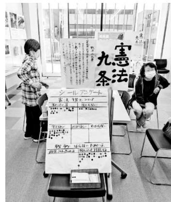
原爆展で自己書で描いた憲法9条を展示、シールアンケートもいっしょに