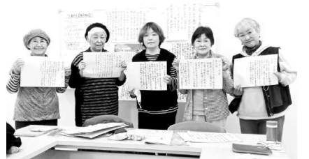
筆ペンで書きました