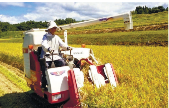
コンバインの操作も手慣れたもの

食料確保は国にとって根幹であり、安全保障です。私がFAOの現時代 女性には介護や家事、育児などの無償労働を担っている。その経済的貢献は年間10・8兆円(約1732兆円)にのぼるといわれる。女性の経済参加を妨げているのです。 日本の食料自給率は低く、1人ひとりが、食料にのぼる食料はどこから来ているのか、肥料や生産のためのエネルギーをどれだけ海外に依存しているか関心を持ってほしい。海外から食料を輸入するのがより困難な時代が来るかもしれません。気候変動の影響で、海外で生産できなくなれば、自分の食料もなくなるといふ連鎖反応があることを知ってほしい。 世界では全体的に農業が縮小傾向にあり、どの国も農業分野への新たな参入を増やす努力をしています。農林水産業での所得を増やすことが決定的ではないでしょうか。