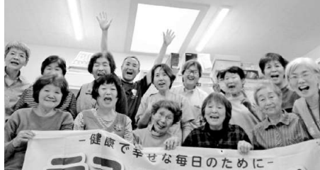
心から「わはは」▲愛知

【磐田支部ラビット班】お料理班会で、今回はホクホクコロッケをたくさん作りました。しんぶんタイムは5月30日号の1面、「戦争とめるために、班でできること考え