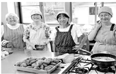
たくさんのコロッケを前に▲静岡