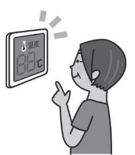
イラストは「高齢者のための熱中症対策」(厚労省)より作成

熱中症を防ぐには、本格的な暑さが到来する前から体を暑さに慣らしておく「暑熱順化」が大切です。軽く汗をかく程度の運動、例えばウォーキングや筋トレ、ストレッチなど30分を週5日や、2日に1回湯船につかる入浴などが推奨されています。いずれも無理のない範囲で、水分の補給も忘れずに。