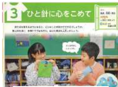
【東書・家庭科・5年】より

社会科でも、地域の歴史を調べる学習のまとめとして、村の人々を救うために通関橋を作った人物に「表彰状を書こう」を例示している教科書がありました。