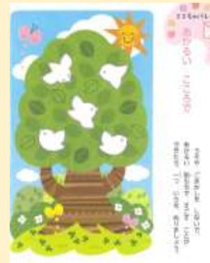
【学図・1年・別冊】より

それだけでなく、「うそやごまかしをしないであかるい気持ちで過ごすことができれば、一つ色をぬりましょう」「きちんとあいさつができれば色をぬりましょう」などというページのある教科書もあります。