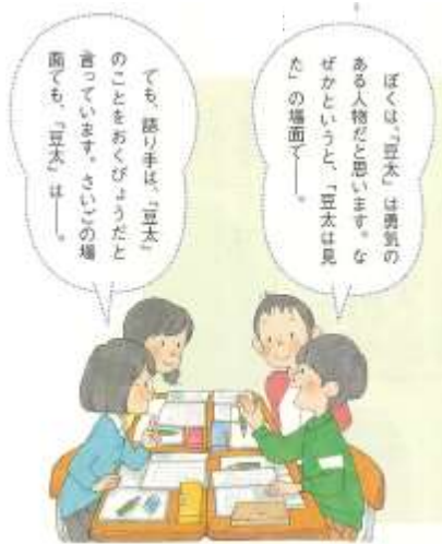
【光村・国語・3年下】より

どの教科も、「課題をつかむ」⇒「調べる」⇒「まとめる」⇒「生かす」などと授業の進め方が示され、それにそって学習の内容が書かれています。