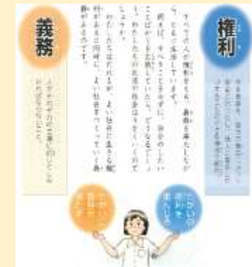
【あかつき・5年】より

一方、子どもの権利条約や世界人権宣言を扱う教科書が増えました。戦争と平和、人権などについて考えることのできる題材もあります。